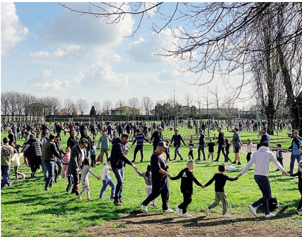
Un'attività con i genitori e i bambini della Sacra Famiglia nei campi della scuola di Martinengo

«La Sacra Famiglia – afferma – è oggi un Istituto scolastico comprensivo, paritario e