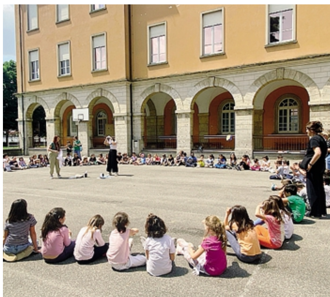
Studenti della Paolo VI nel cortile della scuola

L'offerta didattica della «Paolo VI» si basa su una convinzione fondamentale: «La scuola non è un'isola, ma parte viva di una comunità». Va letto sotto questa l'ente lo stretto legame con il territorio che caratterizza la sua offerta formativa, a partire dal rapporto con le parrocchie, gli oratori, le amministrazioni comunali e le agenzie educative, fino al mondo del lavoro, passando anche per il sociale. In particolare, per quanto riguarda il mondo del lavoro, con il progetto Work in Progress, studenti dalla Scuola dell'Infanzia alla Secondaria sono accompagnati in esperienze laboratoriali e incontri con aziende e professionisti di diversi settori: «Questo permette ai bambini di imparare facendo: dal preparare il pane presso la Fondazione Isb di Tor-