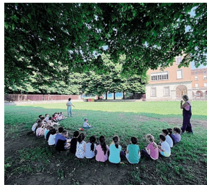
Un'altra attività all'aperto per gli alunni