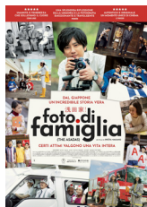
FOTO DI FAMIGLIA

di Ryōta Nakano, con Kazunari Ninomiya e Satoshi Tsumabuki, Giappone 2020, 127'