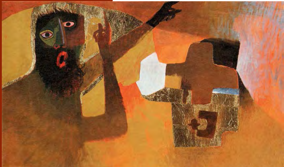
Jean, le Baptiste Huile sur toile Saint-Hugues-de-Chartreuse (France)