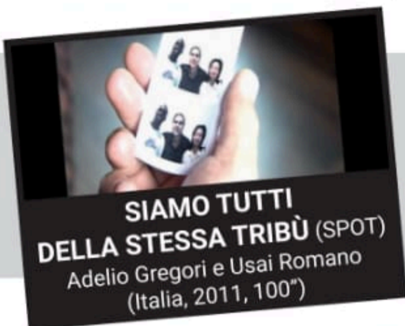
SIAMO TUTTI DELLA STESSA TRIBÙ (SPOT) Adelio Gregori e Usai Romano (Italia, 2011, 100")

A Element City, fuoco, acqua, terra e aria vivono in perfetta armonia. L'amicizia tra Ember, una ragazzina intrepida, e Wade, un ragazzo amante del divertimento, mette in discussione le convinzioni di Ember sul mondo in cui vivono.