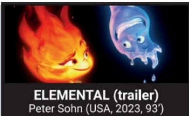
ELEMENTAL (trailer) Peter Sohn (USA, 2023, 93')