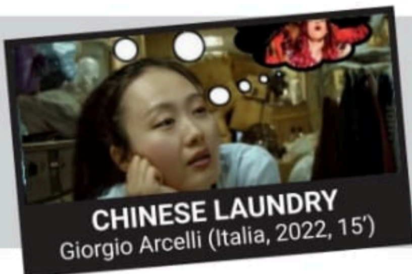
CHINESE LAUNDRY Giorgio Arcelli (Italia, 2022, 15')

Il corto racconta l'insolito tentativo di un piccolo artigiano di insegnare l'arte delle piccole riparazioni al suo nuovo apprendista africano. E lo fa attraverso l'uso del dialetto veneto. Tra incomprensioni e equivoci i due protagonisti scopriranno che la difficoltà linguistica iniziale non è un ostacolo al capirsi ma una via possibile all'integrazione.