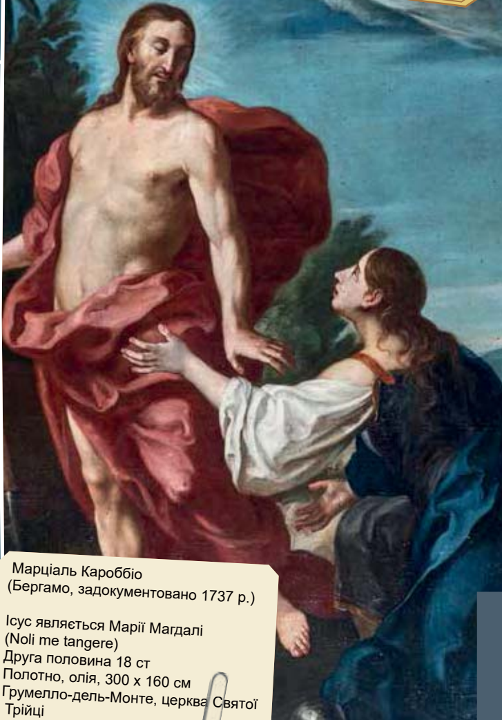
Марціал Кароббіо (Бергамо, задокументовано 1737 р.)

Ісус являється Марії Магдалі ( Noli me tangere ) Друга половина 18 ст Полотно, олія, 300 x 160 см Грумелло-дель-Монте, церква Святої Трійці