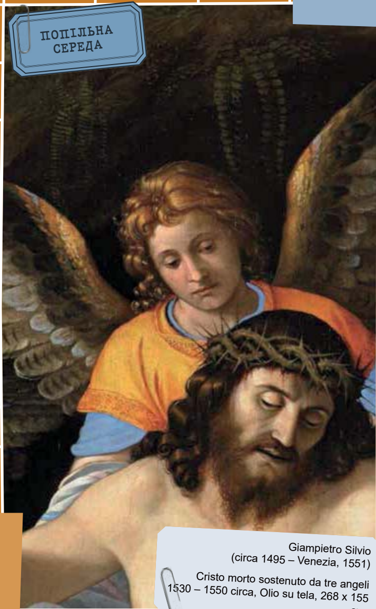
Giampietro Silvio (circa 1495 – Venezia, 1551) Cristo morto sostenuto da tre angeli 1530 – 1550 circa, Olio su tela, 268 x 155 cm