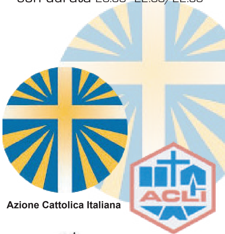
Azione Cattolica Italiana

gli incontri si tengono presso la SALA della COMUNITA' dell' Oratorio di S. Zenone in Cisano Bergamasco con durata 20:30 - 22:00/22:30